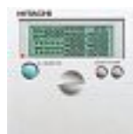
Mando a distancia semanal